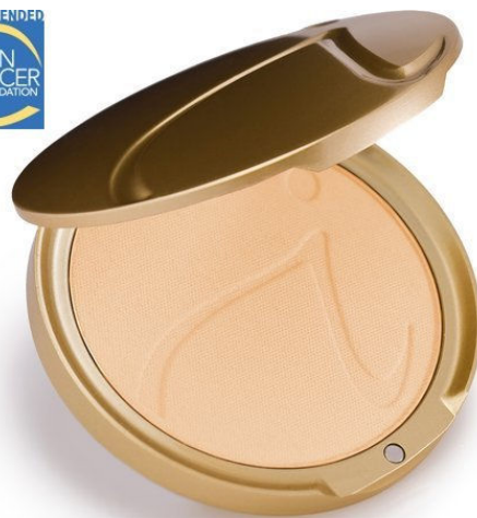
Puder prasowany (PurePressed Base) Waga netto 9.9 g/.35 oz